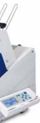
AS-960 HD AS-990 HD